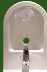
BIDET A PAVIMENTO