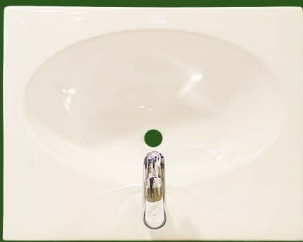
LAVABO A CONSOLLE 65