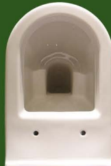
VASO A PAVIMENTO